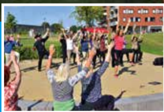
Aan de slag met Olga Commandeur