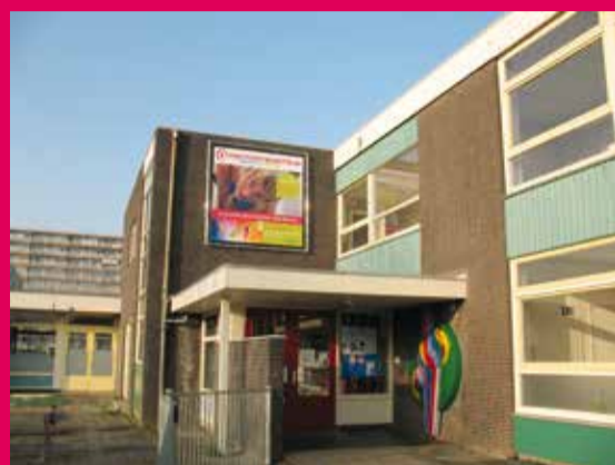
School Van Duvendorpad

In de oude school aan het van Duvendorpad zat de Ambachtenwerkplaats van Piëzo. Ook de kledingbank van MEVE zat daar tijdelijk. Waar nu de school staat, komt nieuwbouw. Daarom wordt de school begin volgend jaar gesloopt. De Ambachtenwerkplaats van Piëzo is inmiddels verhuisd naar de wijk Meerzicht. De kledingbank van MEVE gaat verder op hun bestaande locatie in Meerzicht.