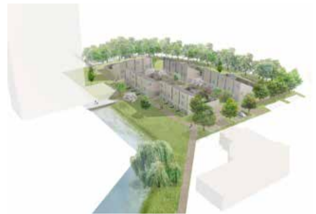
Impressie van Asseliershof

In Asseliershof ontwikkelt en realiseert Bébouw Midreth uit Mijdrecht 21 energiezuinige eengezinswoningen. De ruime eengezinswoningen liggen rond een gemeenschappelijke binnentuin. De woningen zijn energiezuinig; minimale woonlasten en een schoner milieu. De zogenaamde nul-op-de-meter woningen wekken net zoveel energie op als ze verbruiken. Dat betekent dat een gemiddeld gezin bij gemiddeld verbruik en gemiddelde weersomstandigheden geen energierekening meer heeft. Door de extreme verlaging van de energielasten kan bij de koop van een nul-op-de-meter woning ca. € 26.000,- extra hypotheek worden gefinancierd.