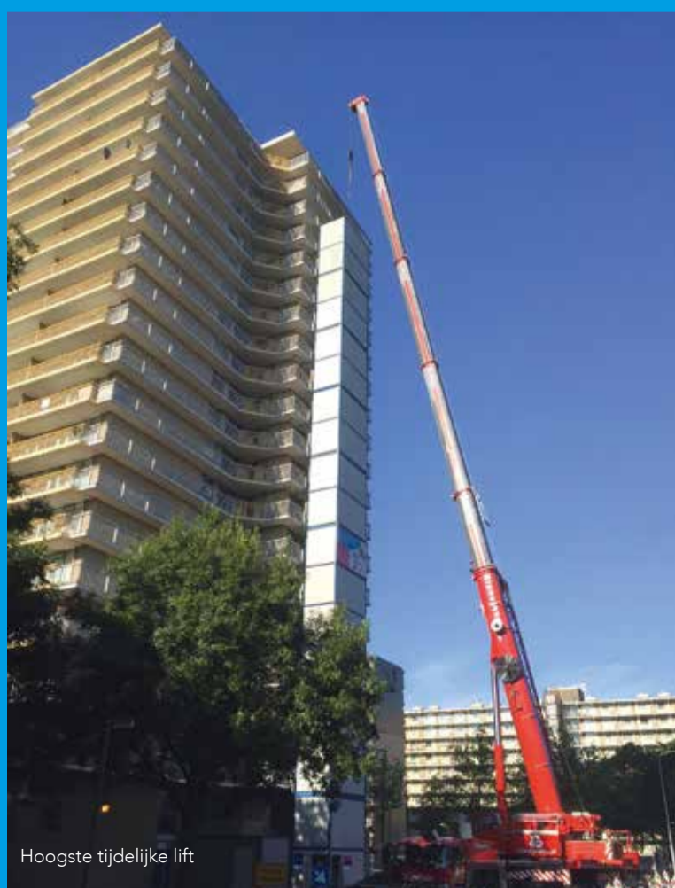
Hoogste tijdelijke lift

Om te zorgen dat ook tijdens de renovatie alle verdiepingen bereikbaar waren, is een tijdelijke lift geplaatst aan de buitenkant van de flat met in totaal 21 stops. Dit bleek de hoogste gesloten tijdelijke lift die geplaatst is in Europa! De nieuwe liften zijn inmiddels al een tijdje in gebruik en de bewoners zijn er blij mee.