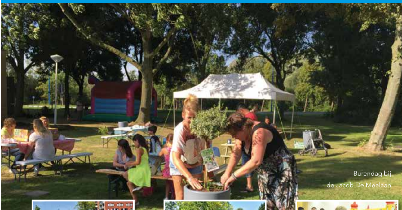
Burendag bij de Jacob De Meelaan

Wie geïnteresseerd is in een ruime, energiezuinige woning in Asseliershof kan zich inschrijven via www.myownhome-asseliershof.nl . De start verkoop is gepland begin 2017.