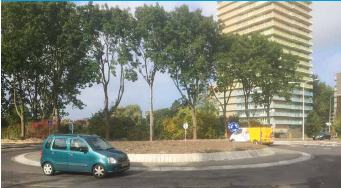
Zo ziet de nieuwe rotonde er uit

De eerste rotonde op de kruising Van Aalstlaan/Van Diestlaan/Van der Hagenstraat is gereed. De aanleg van deze nieuwe rotonde is sneller afgerond dan gepland. Het verkeer kon half oktober al gebruik maken van de rotonde. Het gevaarlijke kruispunt is hiermee verleden tijd.