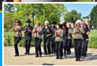
Workshop linedance op het podium