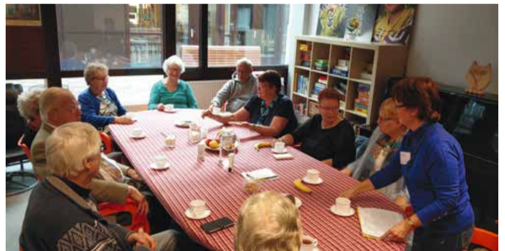
Oudereninloop in PiëzoCentrum Palenstein

Christine@stichtingpiezo.nl • 079-8887770 • www.stichtingpiezo.nl PiëzoCentrum Palenstein: Rakkersveld 253.