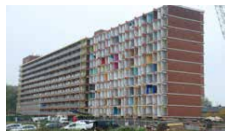
De Florens van Brederodeflat pal voor het sloopevenement