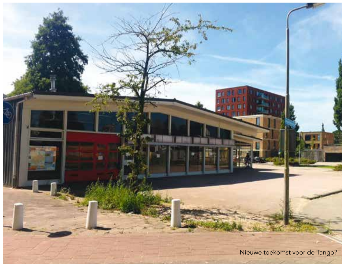
Nieuwe toekomst voor de Tango?

Er zijn verschillende mogelijkheden. Bijvoorbeeld wonen, werken, welzijn, onderwijs, cultuur, sport et cetera. Wel moet rekening worden gehouden met eventuele vergunningen en nog nader te bepalen huurkosten. Heb je een goed idee? Laat het ons weten door een e-mail te sturen naar palenstein@zoetermeer.nl .