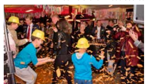
Feestje voor buurtbewoners in de Tango garage