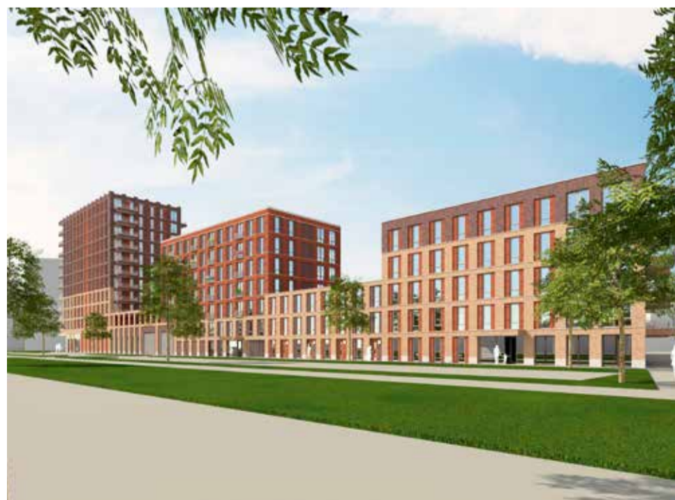
Zo gaat het Stadskwartier er uit zien!

Kijk op de website van Het Stadskwartier: www.stadskwartierpalenstein.nl . Wilt u op de hoogte blijven? Meld je dan via die website aan voor de digitale nieuwsbrief.